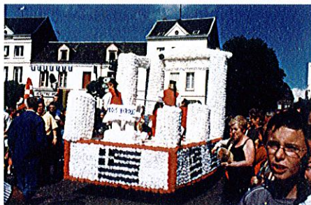
Char de Bois-Héroult : la Grèce

Merci également aux personnes venues nombreuses nous applaudir lors du défilé... Et à l'année prochaine !!!